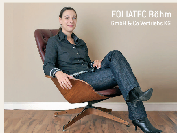
FOLIATEC Böhm GmbH & Co Vertriebs KG

"Für die Umsetzung unseres Affiliate Systems hat Ancud IT eine neue Online-Plattform entwickelt, in der die Affiliates durch verschiedene Funktionen im Backend ihren Shop verwalten und konfigurieren können. Auf dieses System haben wir mittlerweile unseren kompletten Online-Shop umgestellt."